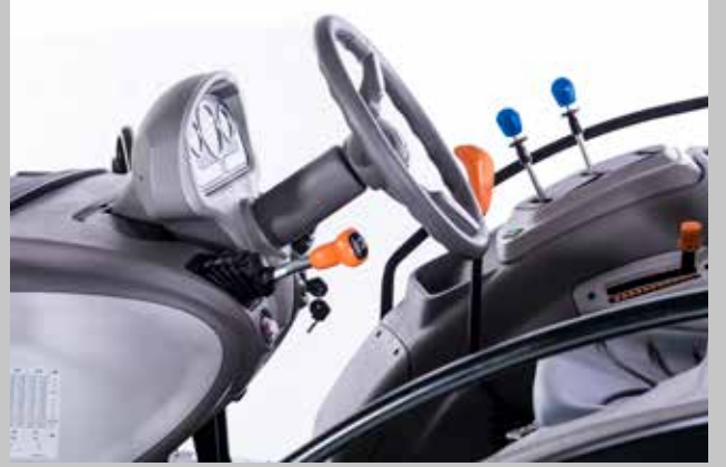
Rakipsiz ön konsol.